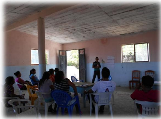
Ilustración 05. Ejercicio de análisis de la situación del acceso a la información y rendición de cuentas.