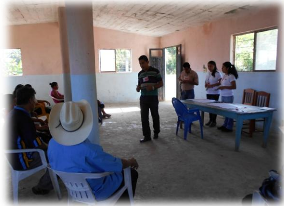
Ilustración 02. Explicación de las actividades a realizar en lengua materna Náhuatl.