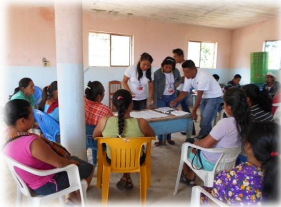
Ilustración 03. Grupo de trabajo con las mujeres donde expusieron sus necesidades y problemáticas.