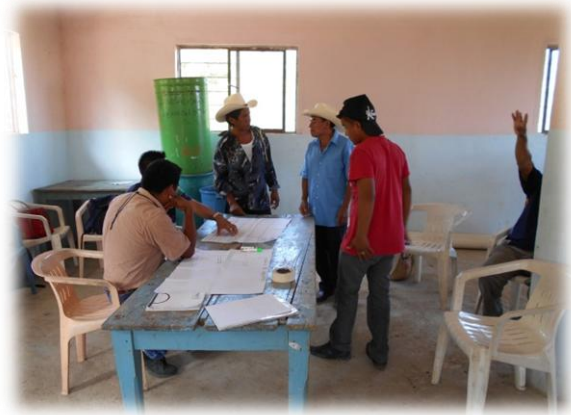
Ilustración 04. Grupo de trabajo con los hombres en donde expusieron sus necesidades y problemáticas.