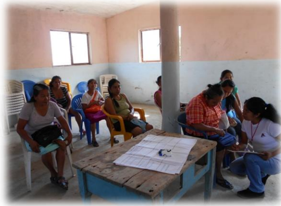
Ilustración 01. Registro de los participantes al taller de evaluación diagnóstica.