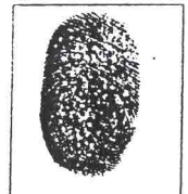
HUELLA DIGITAL dedo pulgar derecho

PATRIA MEXICO ORIGEN MATEHUALA, S.L.P. EDAD 24 AÑOS ESTADO CIVIL SOLTERO COLORES MORENA PELO NEGRO OJOS CAFE OSCURO NALIZ REGULAR BOCA REGULAR ESTATURA 1.70 MTS. SEÑAS PARTICULARES NINGUNA COMPLEXION MEDIA