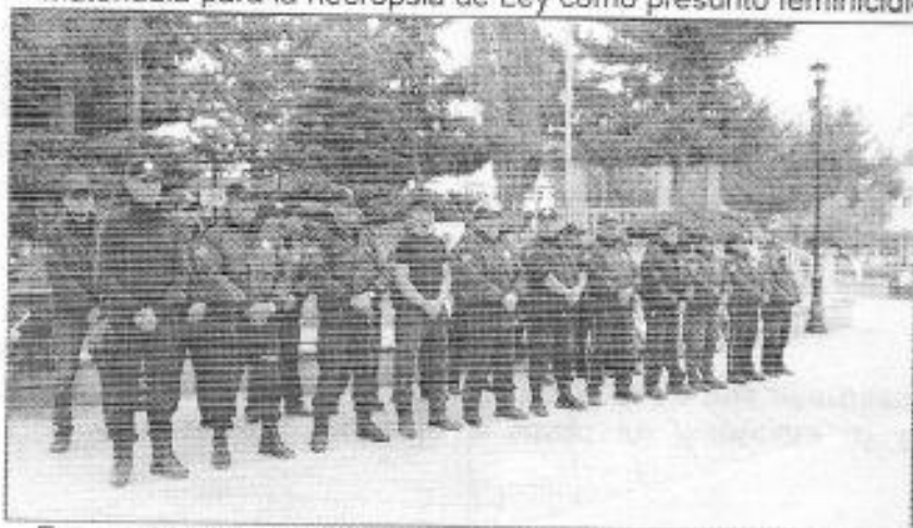
Estatal, Municipal y SEDENA.

Se atendieron reportes de personas heridas con arma de fuego en la comunidad de Guadalupe Victoria, Barrio de Clavellinas, y Ejido Vicente Guerrero, al arribo de los suscritos en coordinación con Paramédicos de Cruz Roja y Policía Estatal, se encontraron personas sin vida dentro de los domicilios, al lugar arribaron la policía Ministerial y personal de Periciales, para el levantamiento de los cadáveres y su traslado a la ciudad de Matehuala para la necropsia de Ley como presunto feminicidio y suicidio.